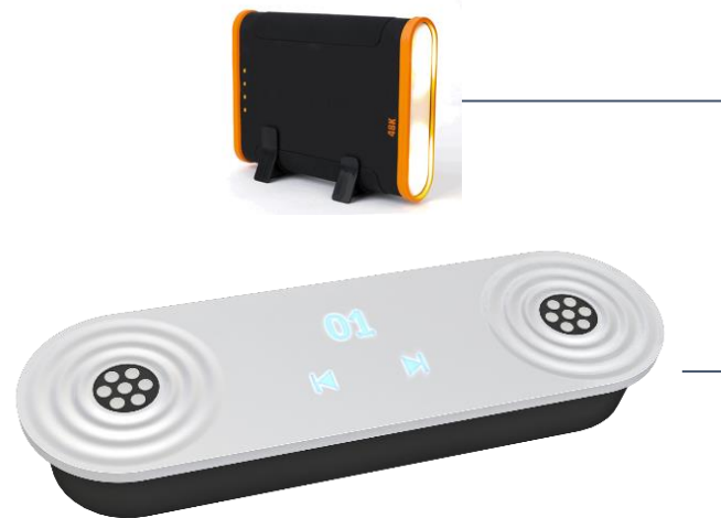
Hörstation « Akku »